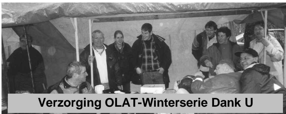
Verzorging OLAT-Winterserie Dank U

DRUKWERK Indien onbestelbaar Lupinelaan 27 5691 WC Son